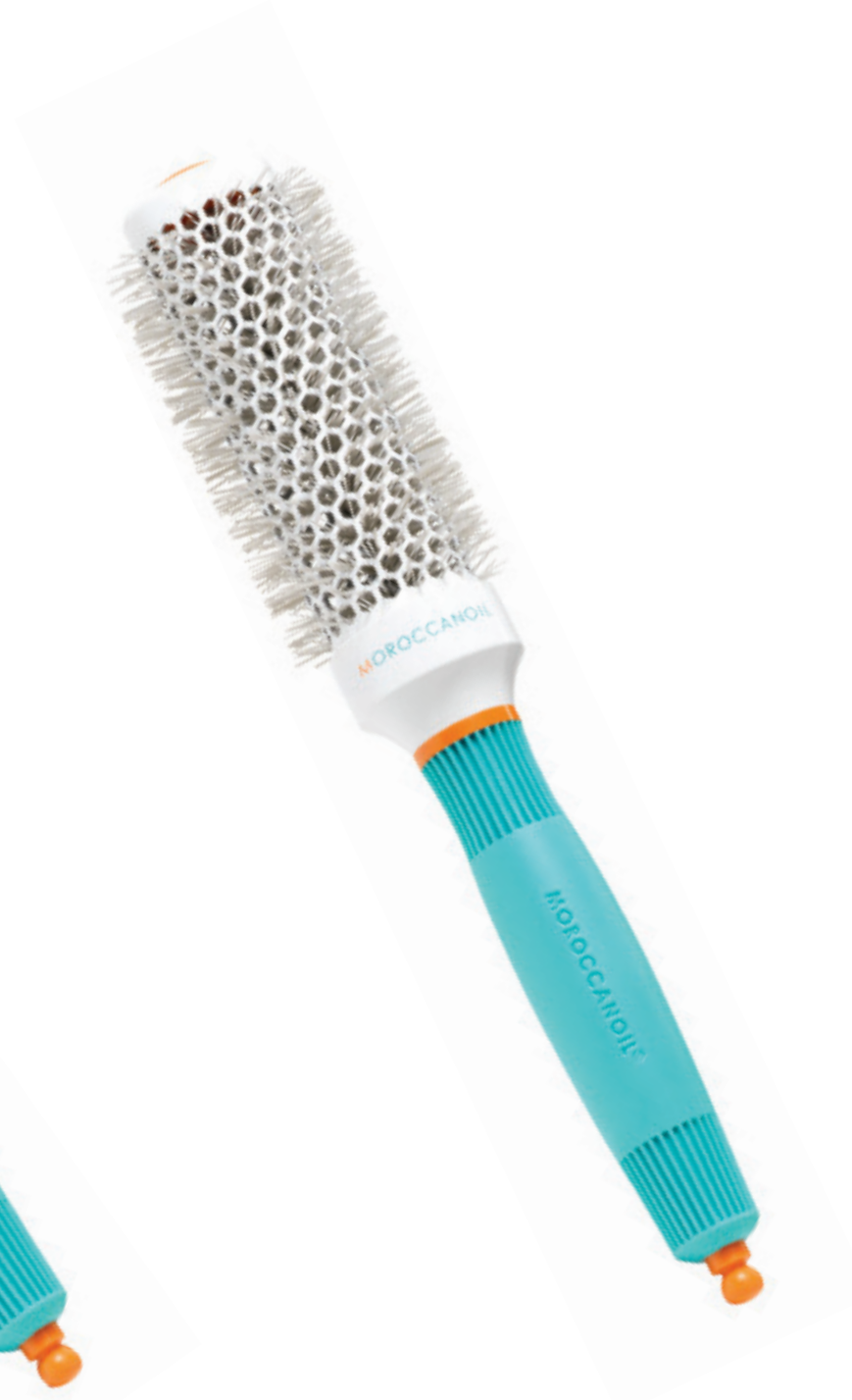
ø35 mm MBRC35 CONDITIONNEMENT x6