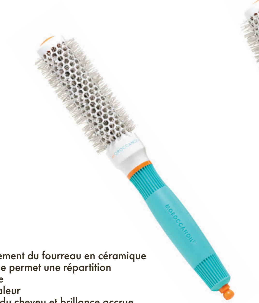
ø25 mm MBRC25 CONDITIONNEMENT x6