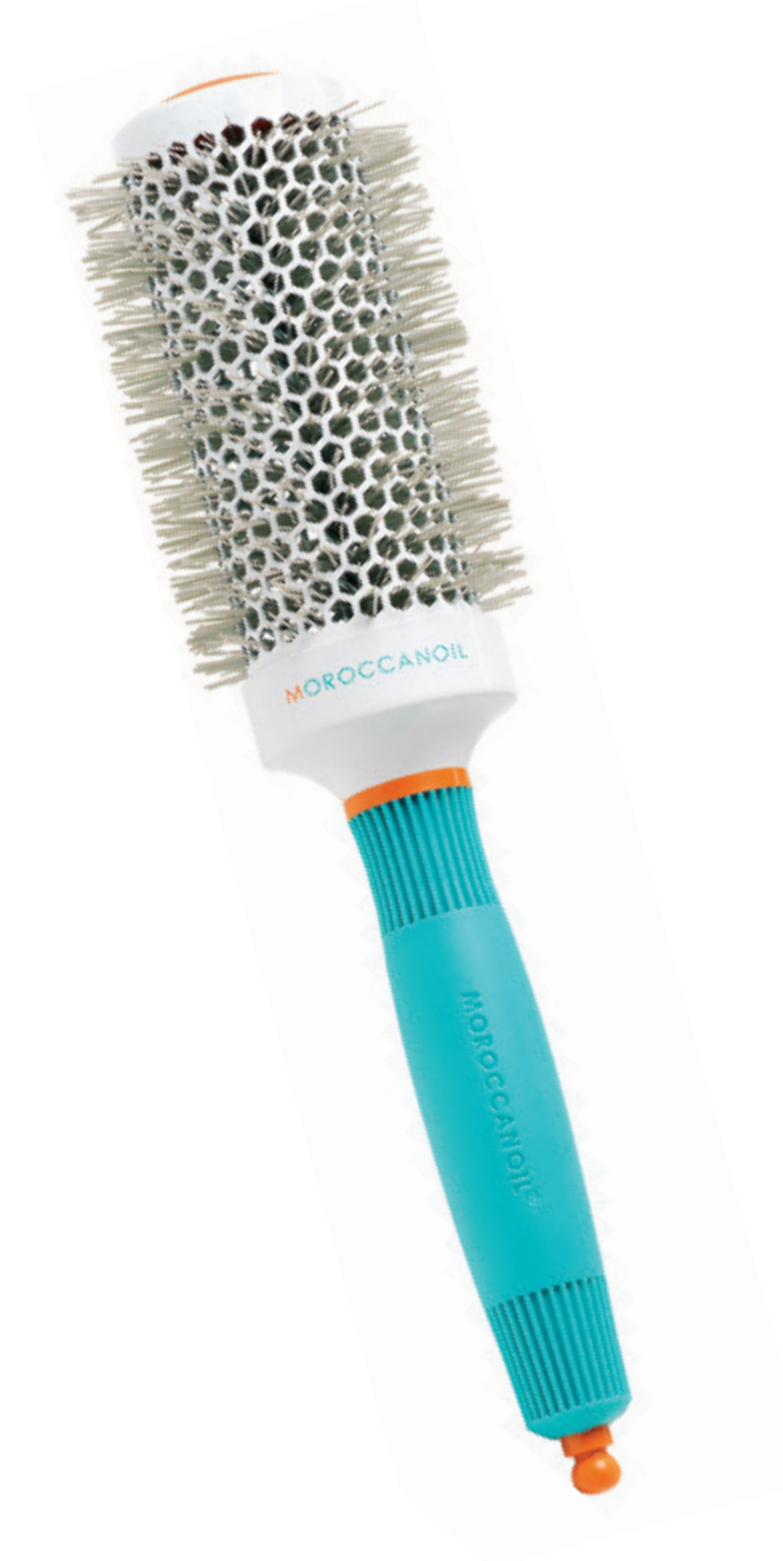
ø45 mm MBRC45 CONDITIONNEMENT x6