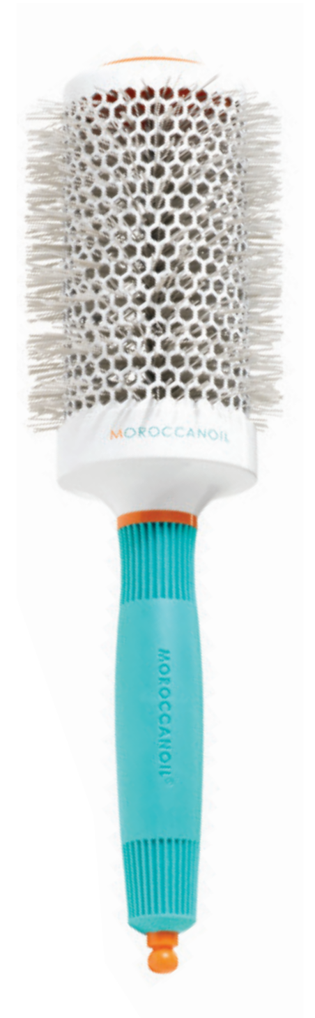
ø55 mm MBRC55 CONDITIONNEMENT x6