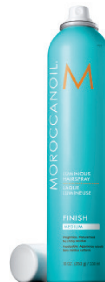
330 ml / Fix. Moyenne MLAL3 CONDITIONNEMENT x12

Pour obtenir un volume plus important, vaporiser à la racine avant de procéder au coiffage.