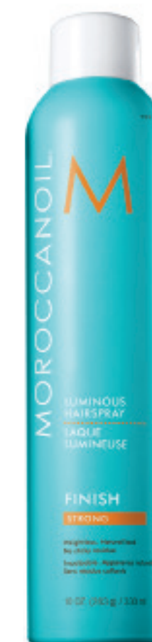
330 ml / Fix. Forte MLAS3 CONDITIONNEMENT x12